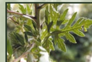
FUSTO E FOGLIE